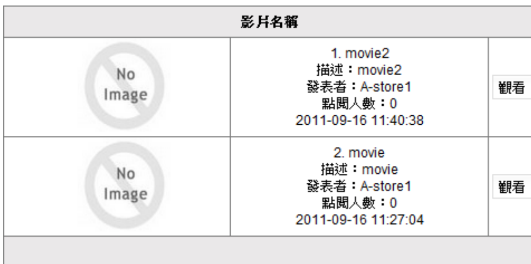
圖形 1.11. 設定前台顯示方式 (一)