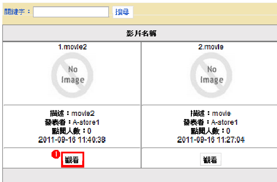
圖形 1.17. 觀賞影音 ( 二 )