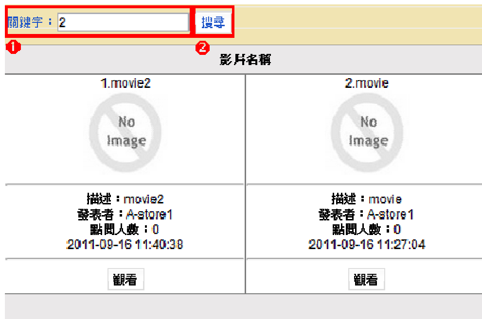
圖形 1.15. 查詢影音 (二)