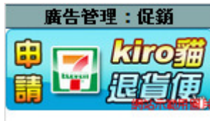
圖形 1.9. 前台顯示介面（一）