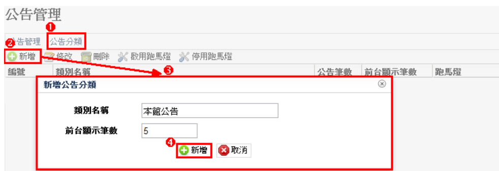
圖形 1.2. 新增公告分類 (一)