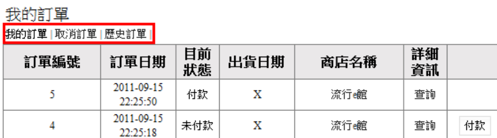
圖形 1.1. 後台操作介面(一)

透過前台之個人訂單管理即可進入此管理頁面，上方子功能選單分別為我的訂單、取消訂單以及歷史訂單，「我的訂單」會顯示目前所有尚未完成交易的紀錄；「取消訂單」會顯示所有記錄，並且可在此進行退貨(退貨功能將於下列「如何退訂商品」進行詳細說明)；「歷史紀錄」則會顯示所有已交易完成之記錄，