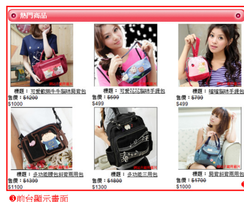
圖形 1.3. 設定最新商品區塊(二)