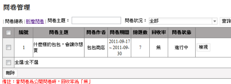
圖形 1.16. 問卷管理 - 刪除問卷(一)