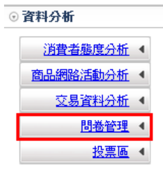
圖形 1.1. 資料分析 - 問卷管理

提供管理者線上問卷之設計、散佈、填寫、統計、列印等功能，一個調查的平台。於左側「資料分析」列表內的「問卷管理」來做問卷的管理。