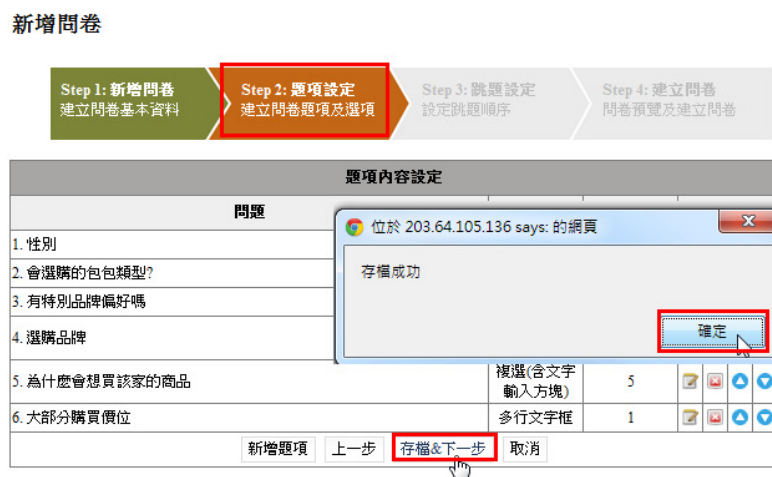
圖形 1.5. 問卷管理 - 新增問卷(三)